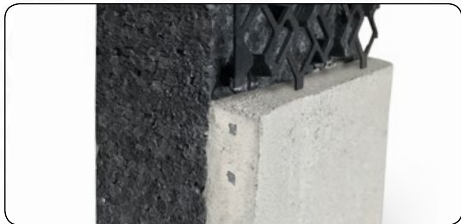
Stratigrafia di un cappotto tradizionale: lo spessore del rasante è di circa 5 mm.